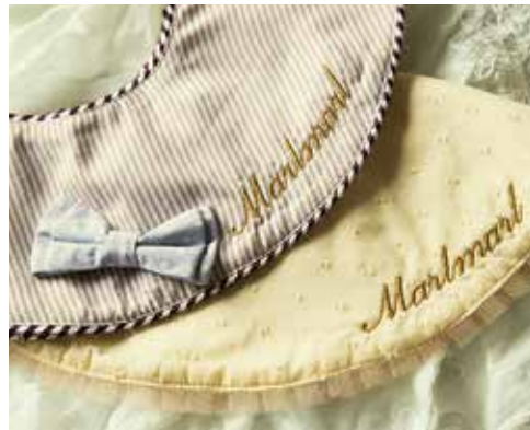
name embroidery 1 piece / ¥300 + tax

The range full of useful items for a newborn includes, the bib, feeding apron, legwarmers, bloomers and other products.